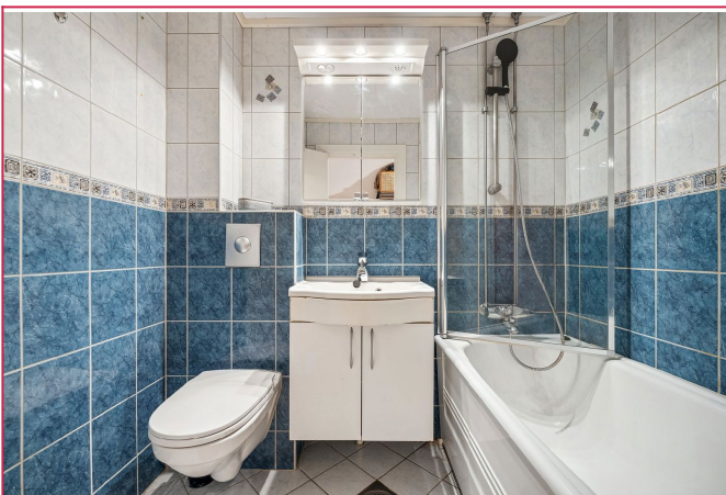
Pent flislagt bad