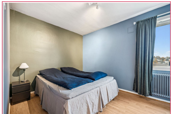
Hovedsoverommet fremstår som lyst og romslig. Innebygd skapsplass