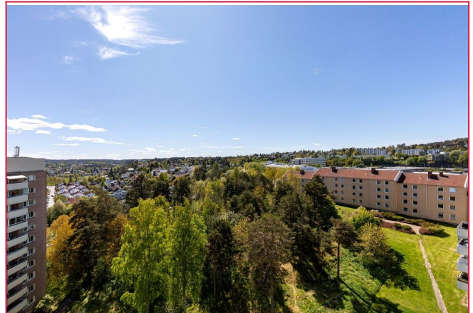
Fin utsikt fra balkongen