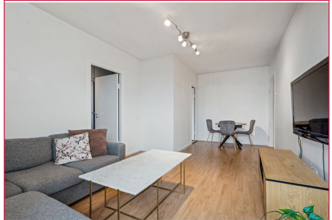
Plass til sofa, spisebord og tilhørende møblement