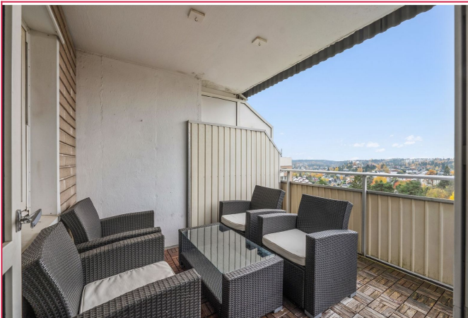
Stor balkong med gode solforhold og flott utsikt