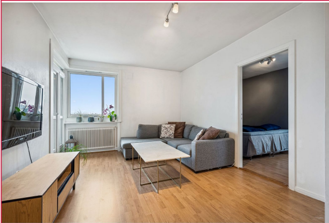
Stue med gode møbleringsmuligheter