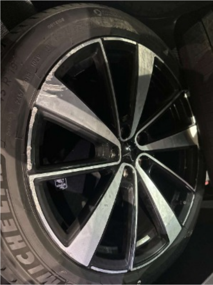
2.18 Kantkjørt sommerfelger(vedlegg)