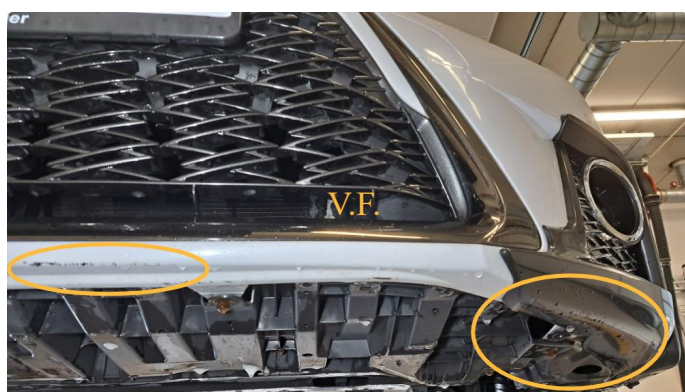
1.1 Noen steinsprut og små lakkskader.