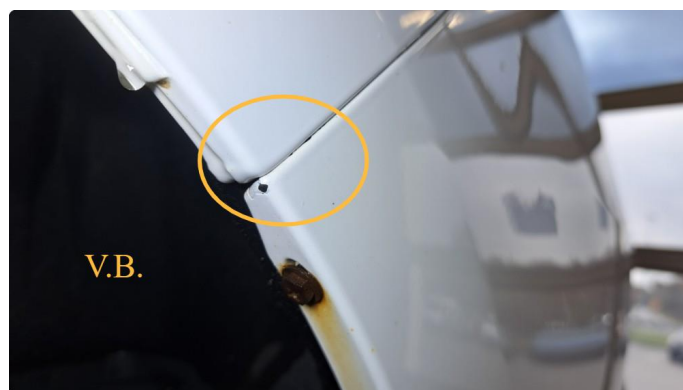
1.1 Noen steinsprut og små lakkskader.