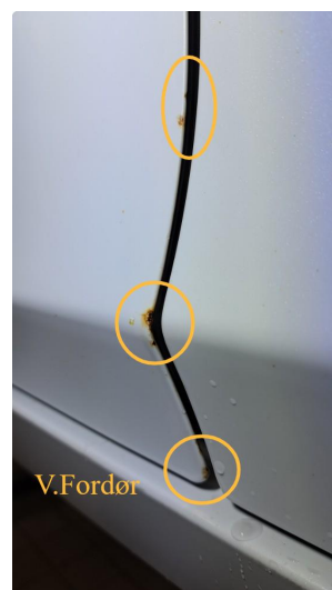
1.1 Noen steinsprut og små lakkskader.