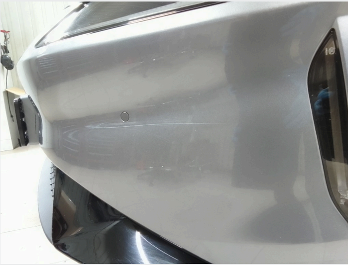
2.8 Riper venstre foran