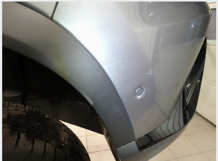
2.8 Riper venstre bak