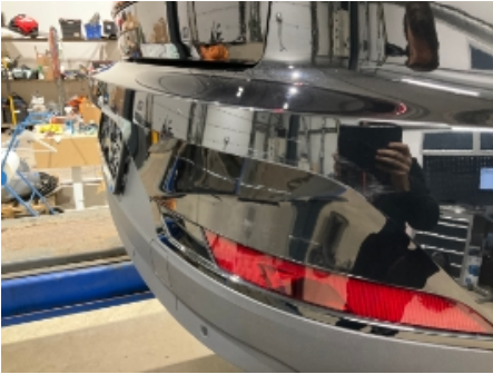
1. Lakk / karosseri utvendig