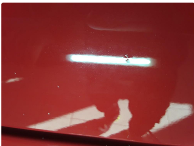
1.3 Steinsprut med korrosjon.