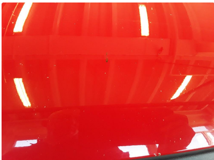
1.2 Noe steinsprut.