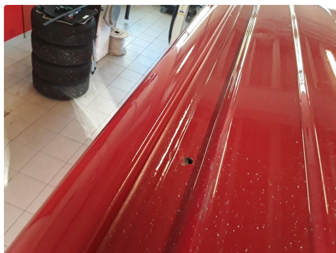
1.5 Noe småbulker.