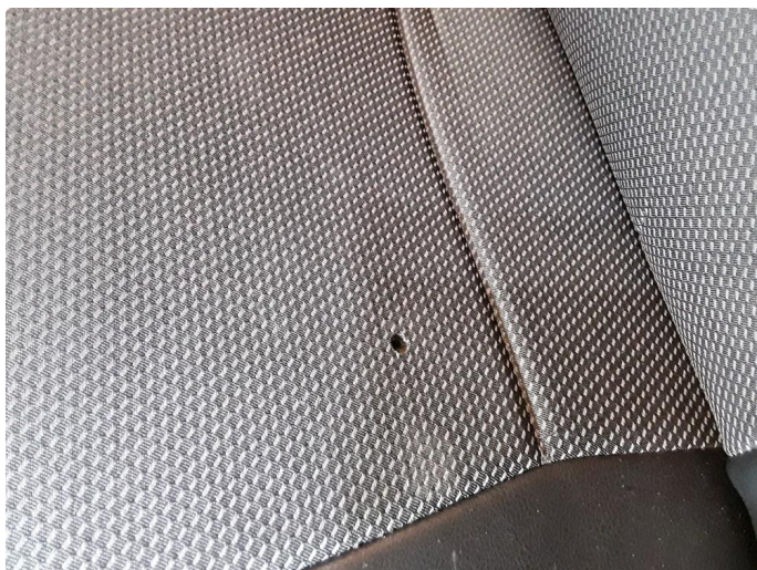
2.1 Lite hull i setetrekk høyre.