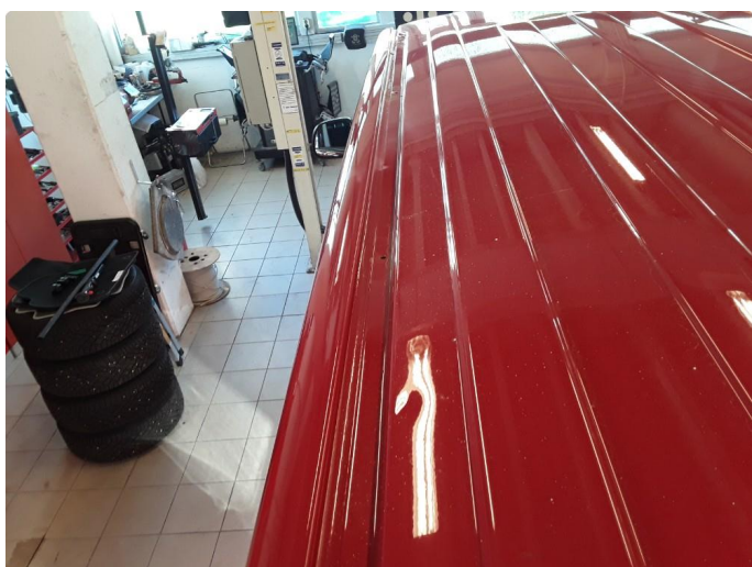
1.5 Noe småbulker.