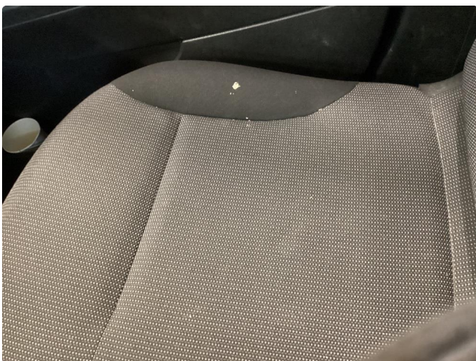
2.1 Merker i seter