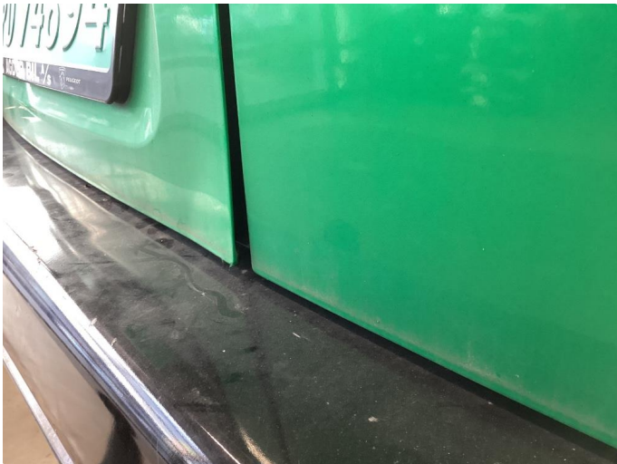
1.2 Bulk uten lakkskade