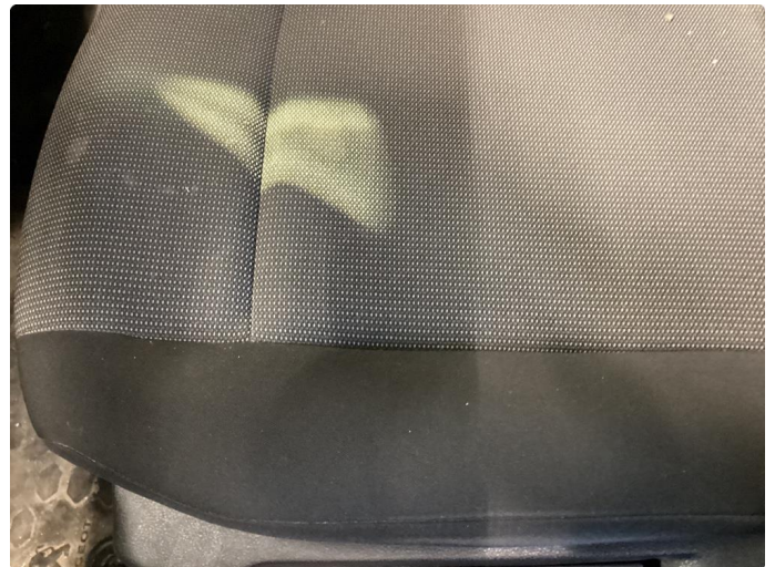
2.1 Merker i seter