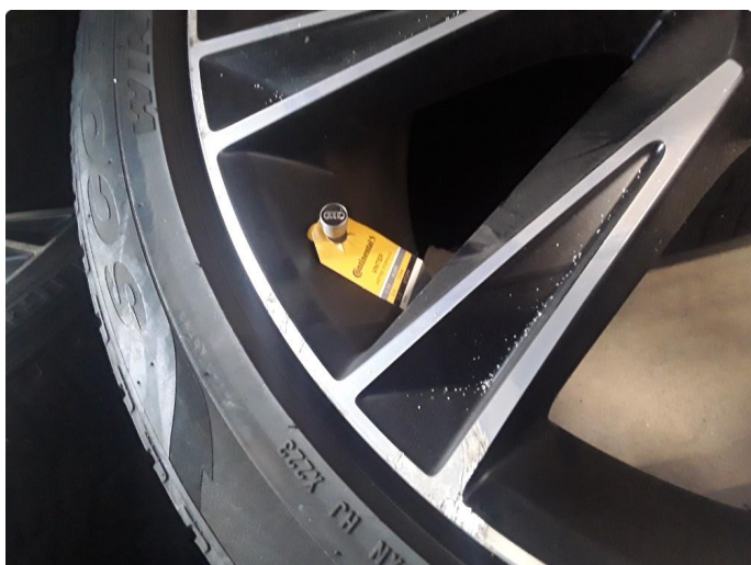
1.2 Kantkjørt felg Diamond Cut