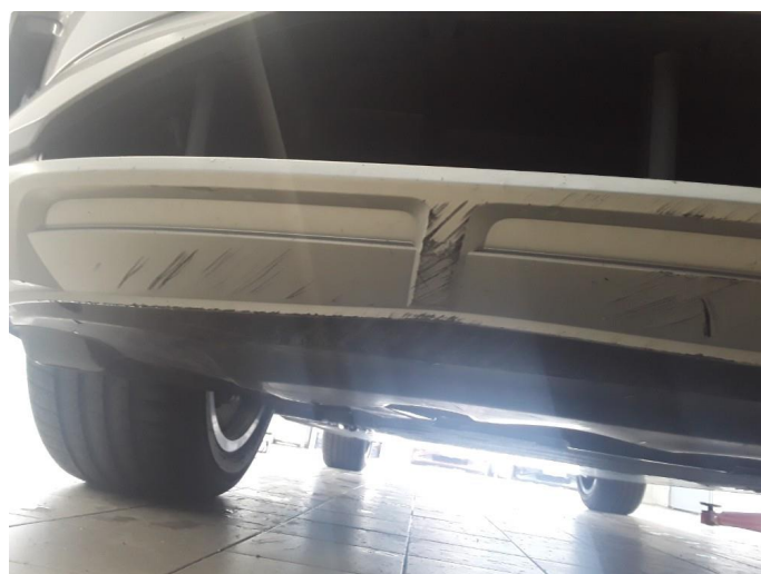
1.5 Skrubbskader underkant