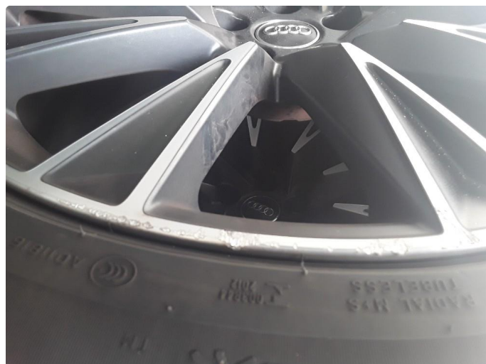
1.2 Kantkjørt felg Diamond Cut