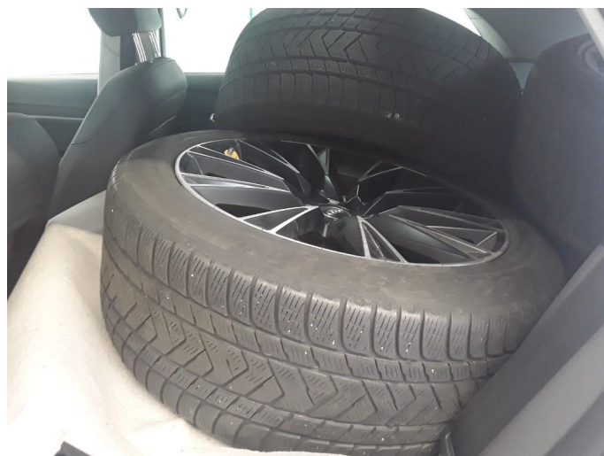
1.3 Øvrige feil