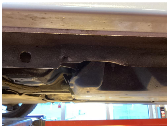
1.2 Øvrige feil