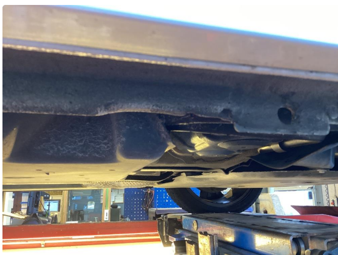
1.2 Øvrige feil