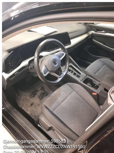
Gjennomgangsnnummer: 598582 Chassisnummer: WVVZZCDZNW191590 Dato: 22.08.2024 13:30