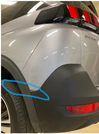
1.3 Ripen er penslet