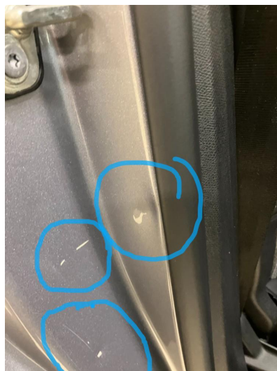
1.1 Ripene er penslet