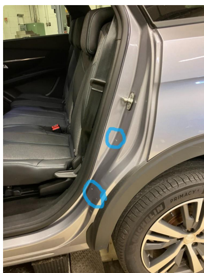
1.1 Ripene er penslet