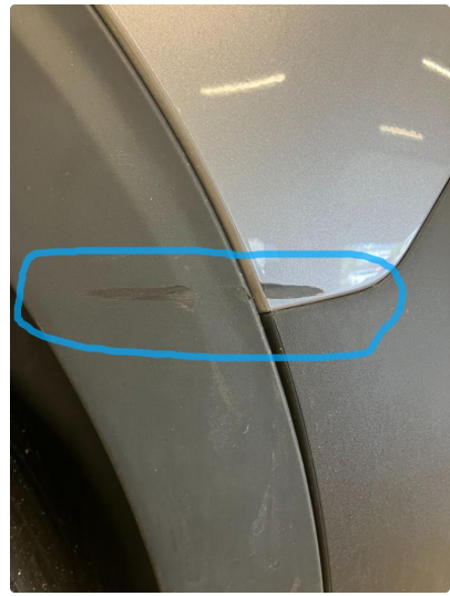
1.3 Ripen er penslet