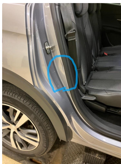
1.1 Ripene er penslet