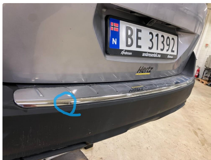
1.2 Øvrige feil