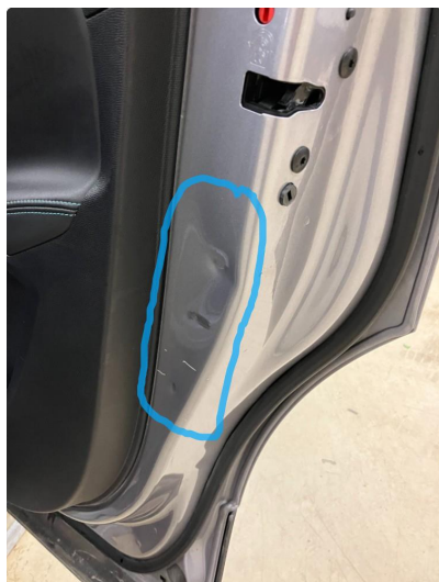
1.1 Ripene er penslet