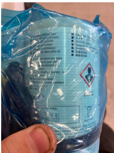
2.1 Dekktemiddel utgått/mangler