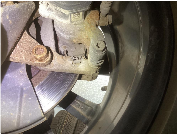
2.1 Slitte/stor slitekant