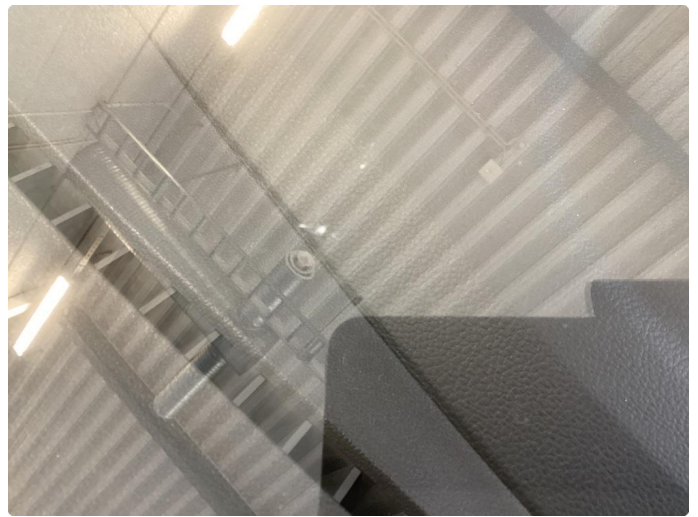
1.3 Steinsprut med sprekk