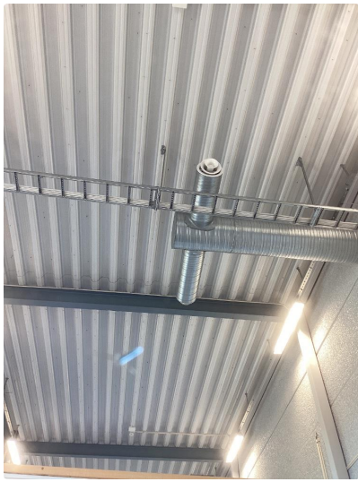
1.3 Steinsprut med sprekk