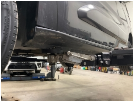
1. Lakk / karosseri utvendig