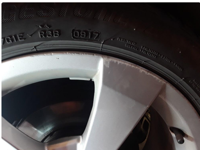
1.2 Noe kantkjørt sommerfelg.