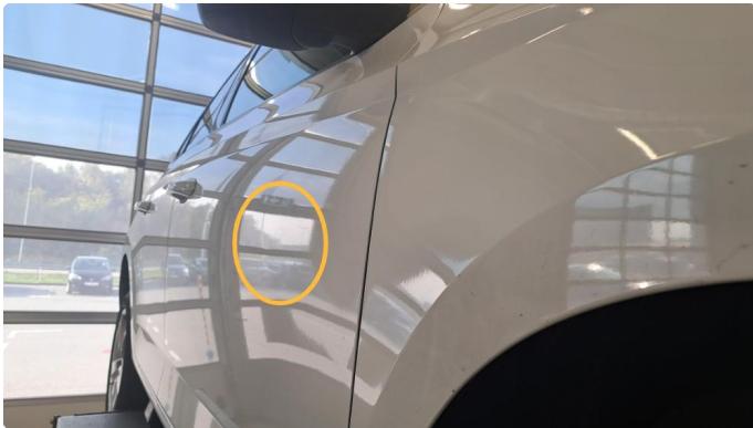
1.1 Svak bulk