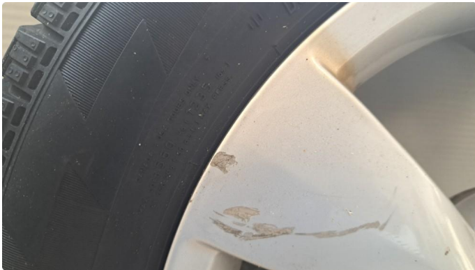
1.3 Ripe i to vinterfelger.