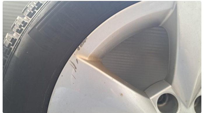
1.3 Ripe i to vinterfelger.