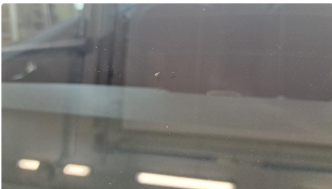
1.4 Liten steinsprut