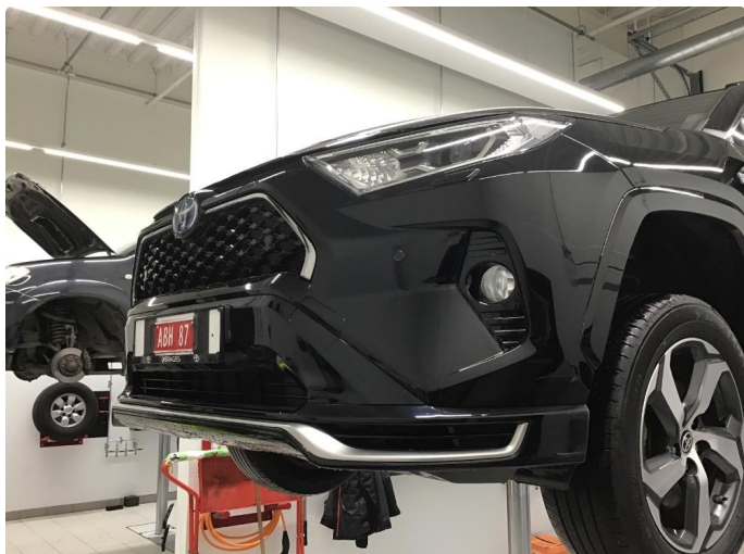
1.1 Ufagmessig utført arbeid