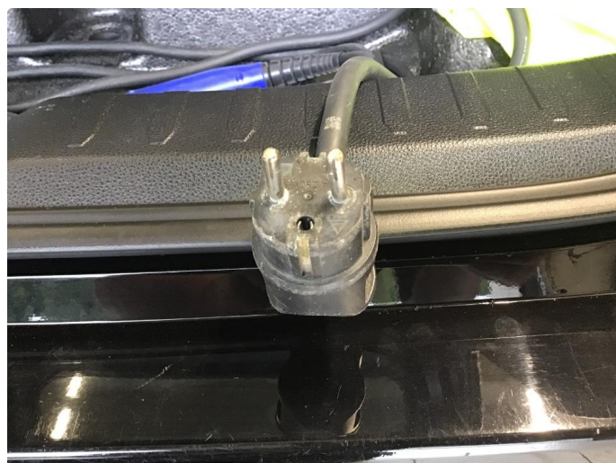
2.1 Ladekontakt skadet