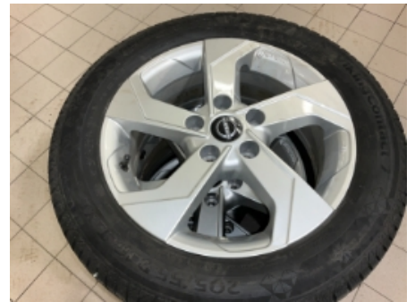
30. Ekstra hjulsett