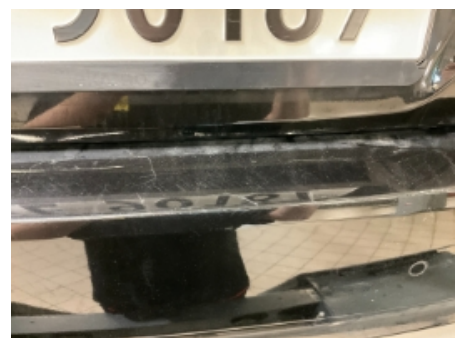
36. Lakk / karosseri utvendig