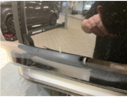
37. Lakk / karosseri utvendig