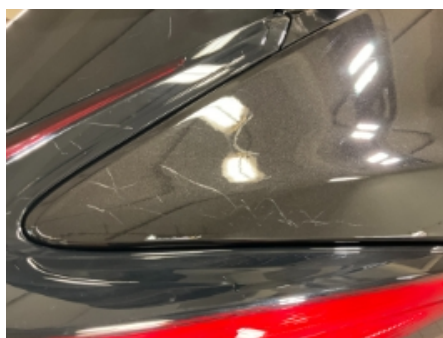
35. Lakk / karosseri utvendig