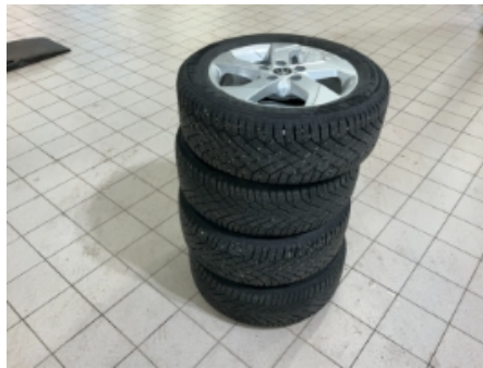
29. Ekstra hjulsett