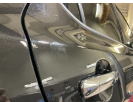
34. Lakk / karosseri utvendig