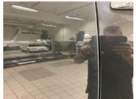
33. Lakk / karosseri utvendig