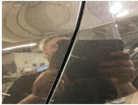
38. Lakk / karosseri utvendig