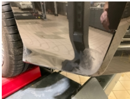
32. Lakk / karosseri utvendig