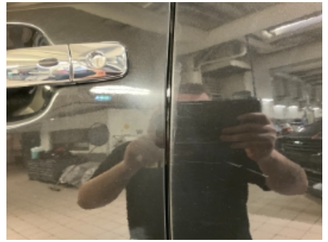
39. Lakk / karosseri utvendig