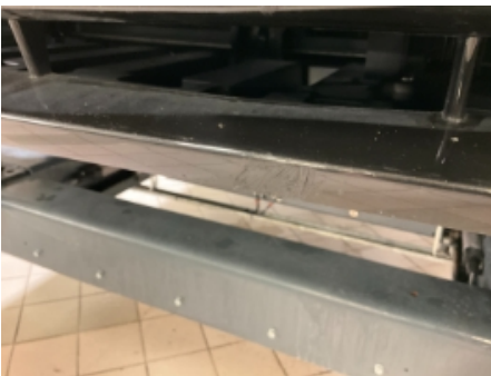
31. Lakk / karosseri utvendig