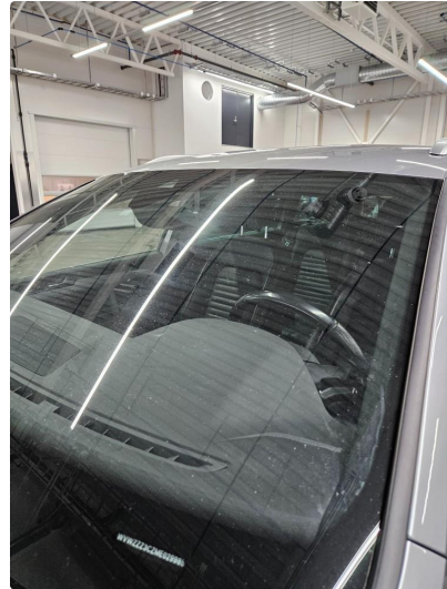
1.3 Div små steinsprut, notert