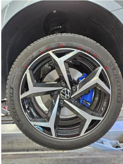
1.1 Noe skubbemerker på ytre kant av sommerfelg, h.side foran ,notert