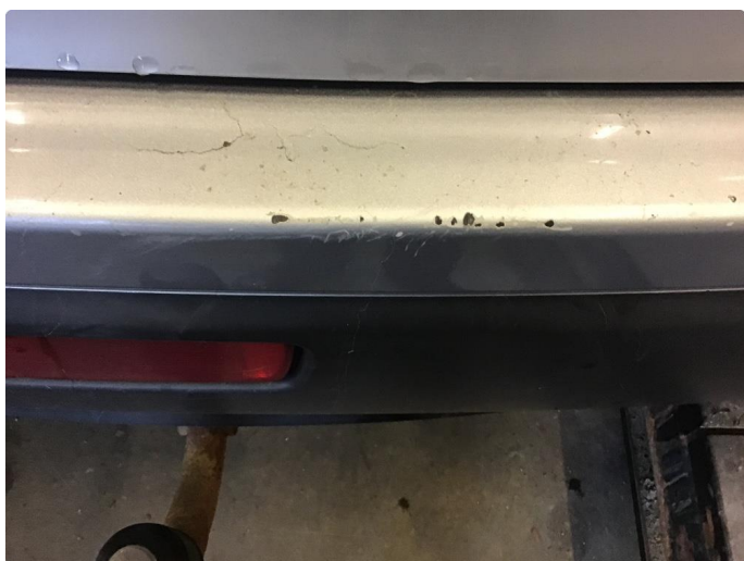
1.6 Lakk flasser