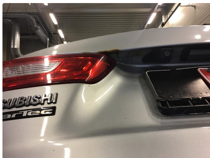
1.4 Øvrige feil