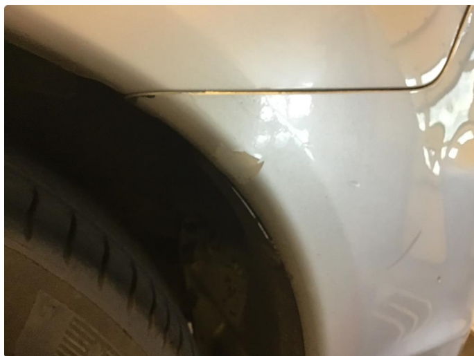
1.6 Lakk flasser