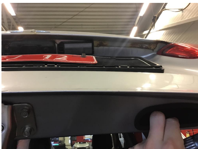
1.4 Øvrige feil