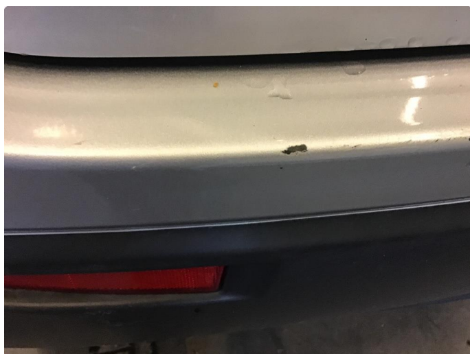
1.6 Lakk flasser