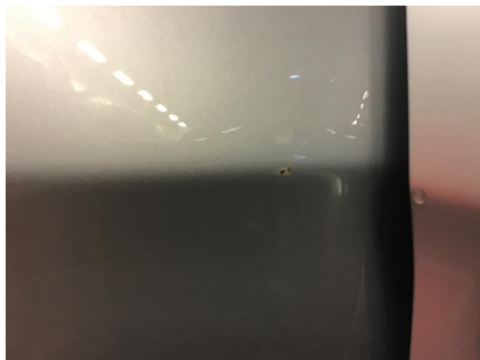
1.2 Rust i fals