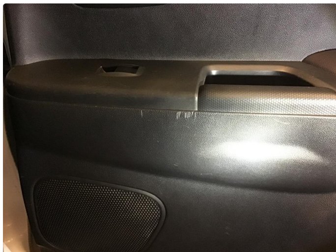
2.1 Øvrige feil