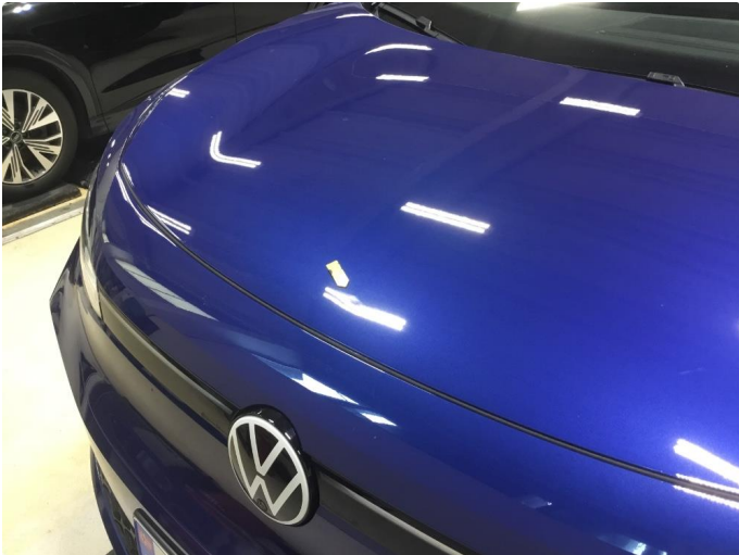
1.1 Liten Bulk panser