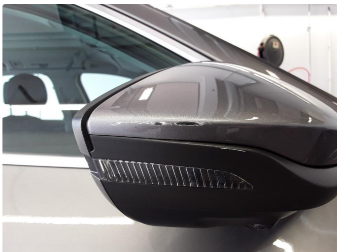
1.1 Speilhus riper