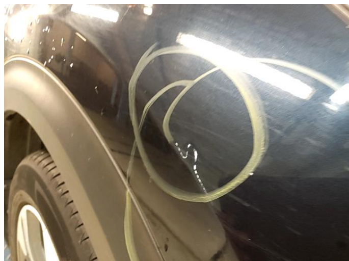
1.2 Flere p-bulker