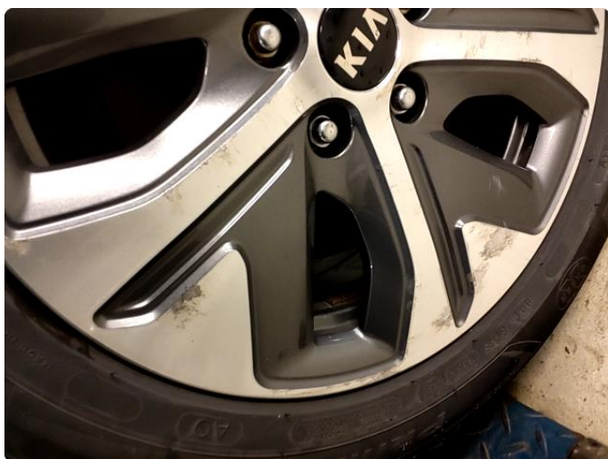
1.6 Betydelig oksidering