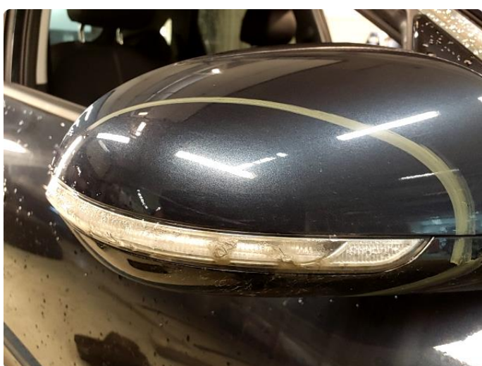
1.4 Blinklys sprukket/krakelert