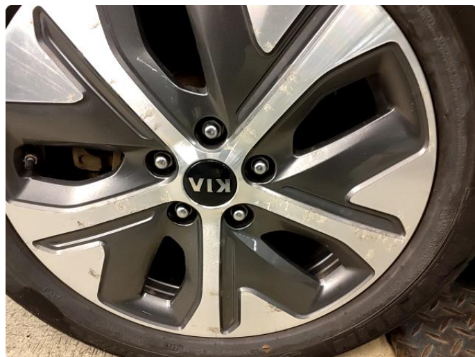
1.6 Betydelig oksidering