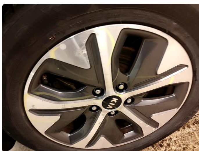
1.6 Betydelig oksidering