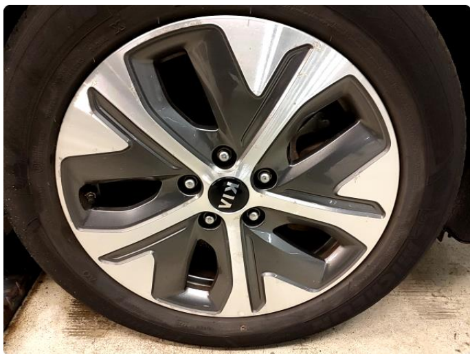
1.6 Betydelig oksidering