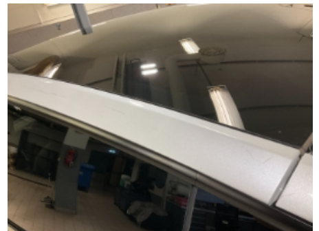
33. Lakk / karosseri utvendig