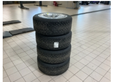
30. Ekstra hjulsett