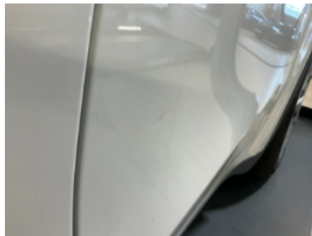
32. Lakk / karosseri utvendig