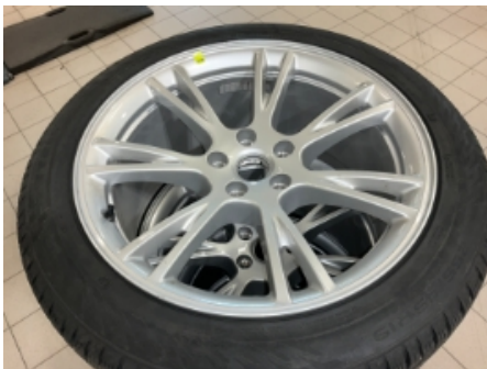
31. Ekstra hjulsett