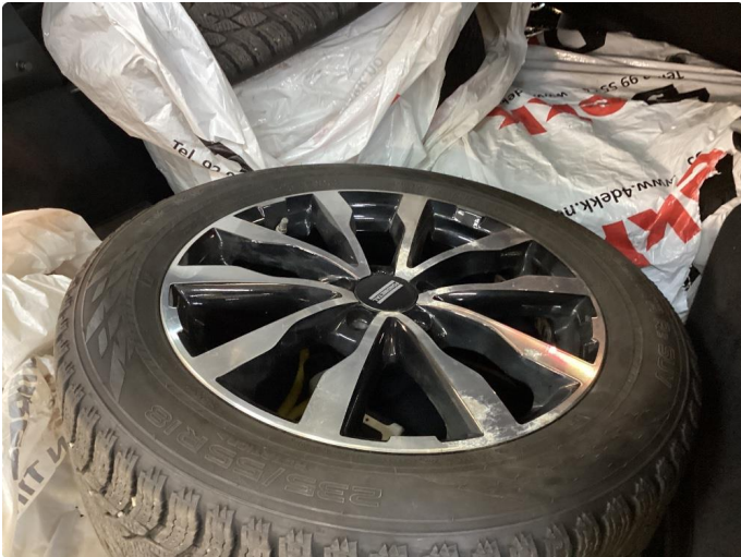
1.1 Påbegynnende oksidering