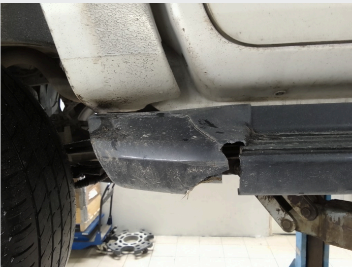
2.4 Knekt kanal deksel v.b