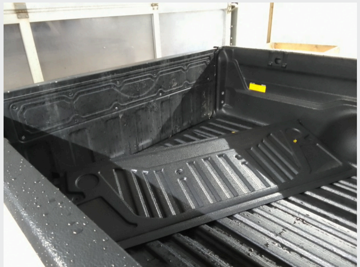
2.5 Plastikk til bakluke ikke festet