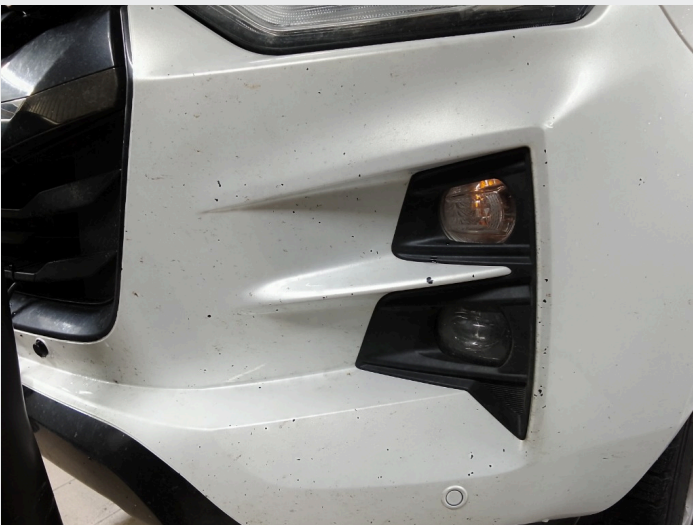
2.8 Mye steinsprut skader i front