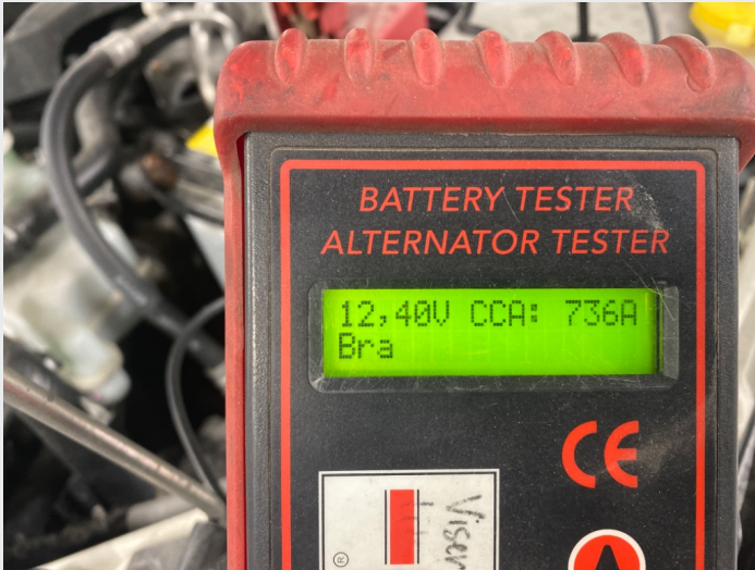
5.2 Batteritest, ok