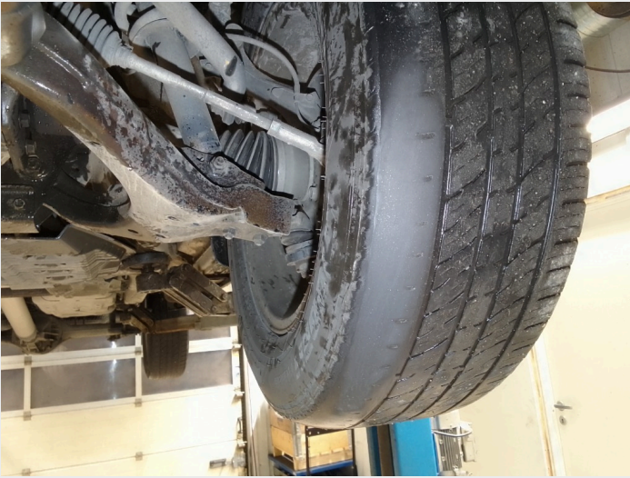
2.17 Dekk foran utslitt inside