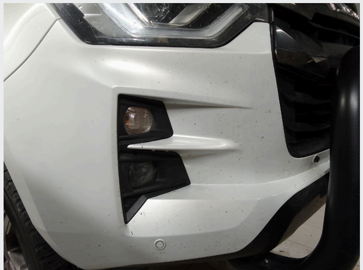
2.8 Mye steinsprut skader i front