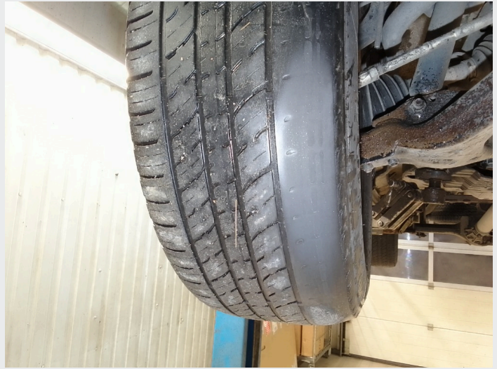
2.17 Dekk foran utslitt inside