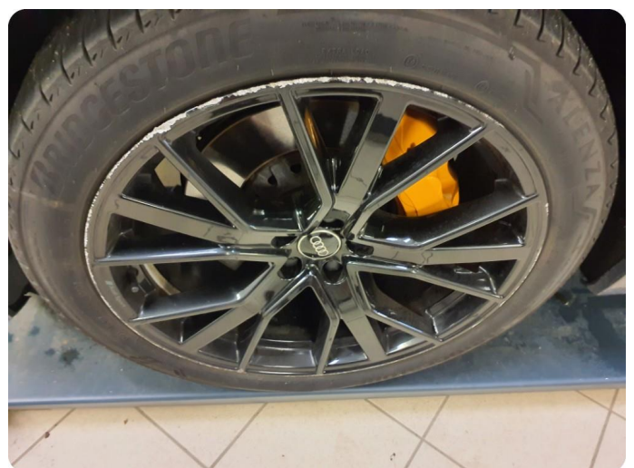
2.8 Kantkjørt felg Sommer