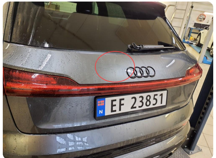
2.5 Bulk med lakkskade