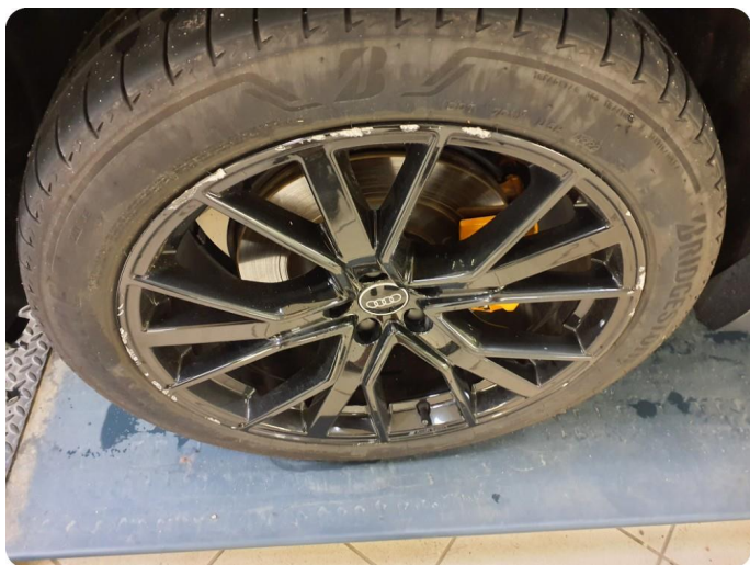
2.8 Kantkjørt felg Sommer