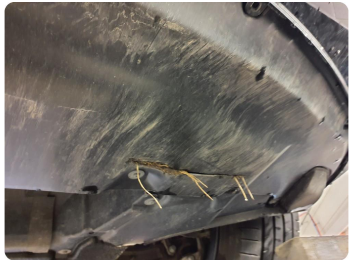
2.3 Beskyttelsesplate skadet/mangler Sprekk