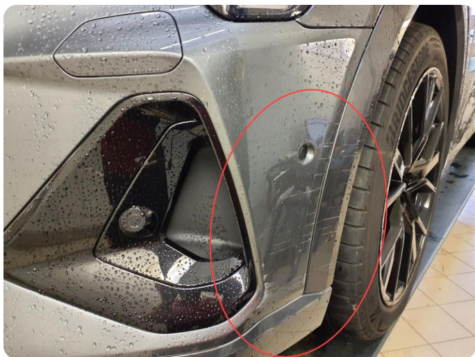
2.10 Ripe(r) ned til grunning