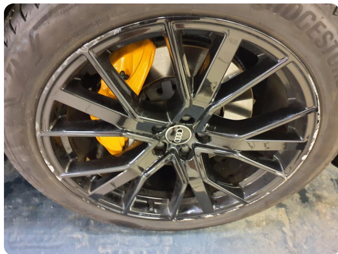
2.8 Kantkjørt felg Sommer