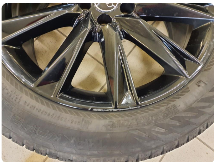
2.9 Kantkjørt felg To stk vinter