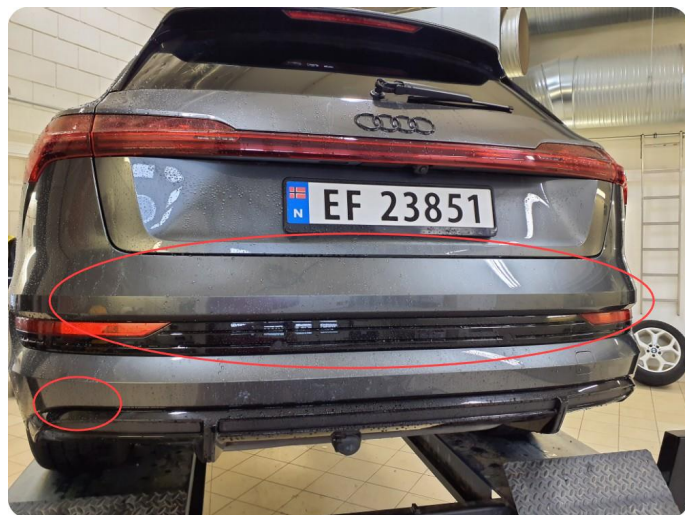
2.11 Ripe(r) Og bruksslitasje