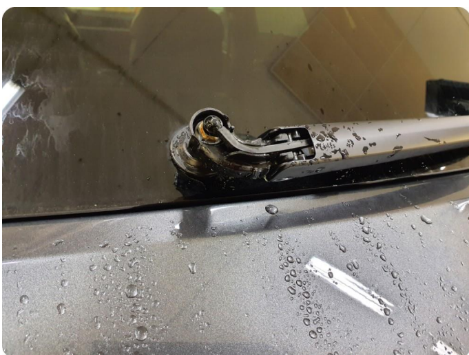
2.6 Mangler deksel pusserarm