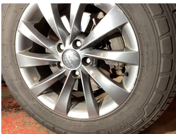
1.3 Litt kantkjørt