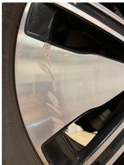
1.1 Kantkjørt felg Diamond Cut