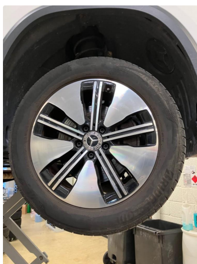
1.1 Kantkjørt felg Diamond Cut