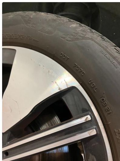
1.1 Kantkjørt felg Diamond Cut