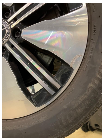
1.1 Kantkjørt felg Diamond Cut