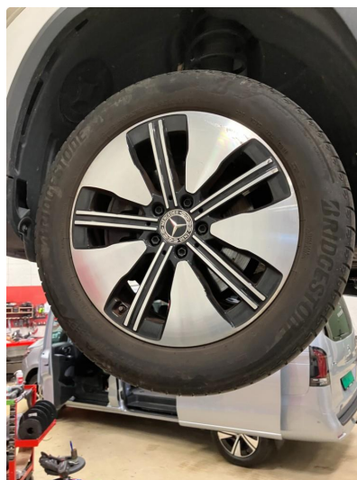
1.1 Kantkjørt felg Diamond Cut