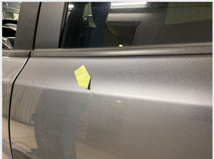
2.5 Liten bulk venstre bakdør