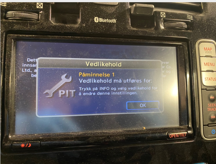
5.11 varsler om vedlikehold