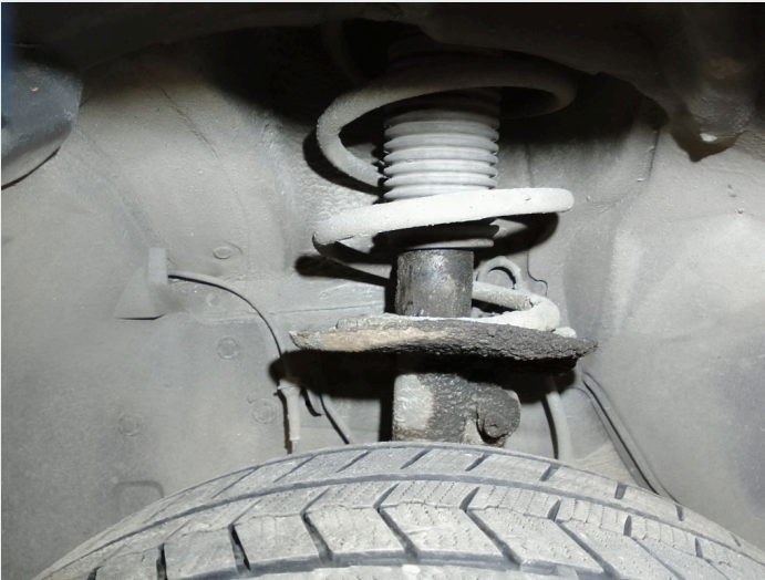
8.6 Svetting demper venstre foran