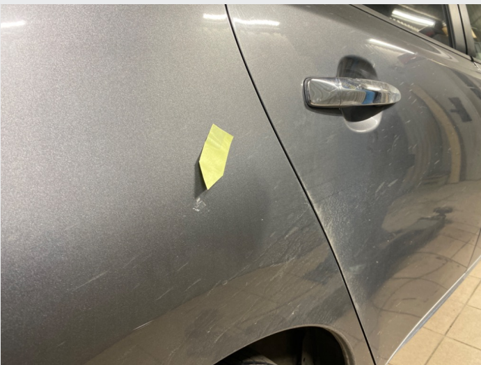
2.7 Lakkskade høyre bakskjerm