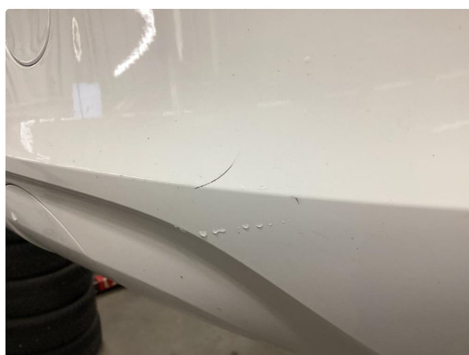
2.4 Liten ripe