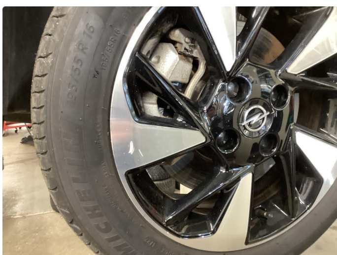
2.3 Kantskade 3 stk sommerfelger