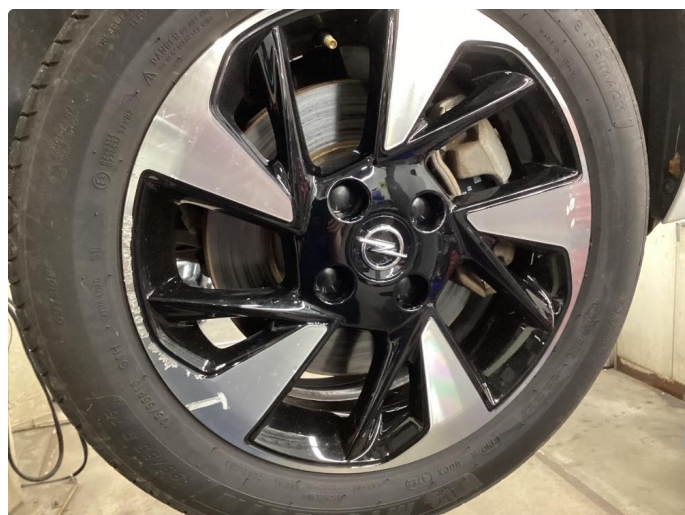
2.3 Kantskade 3 stk sommerfelger