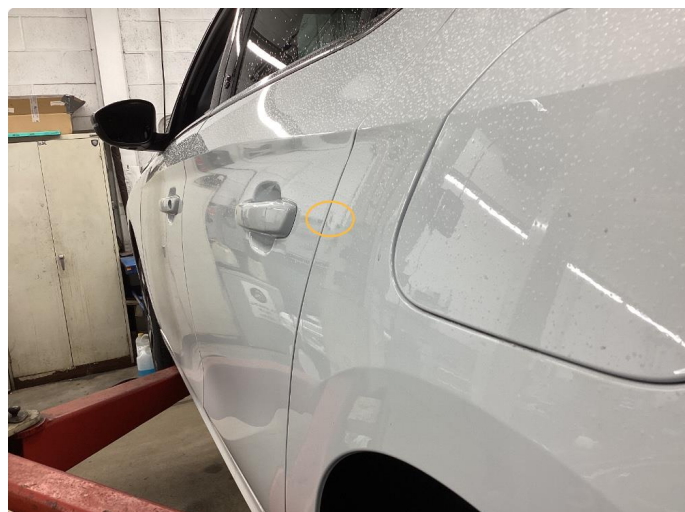
2.2 Liten bulk uten lakkskade