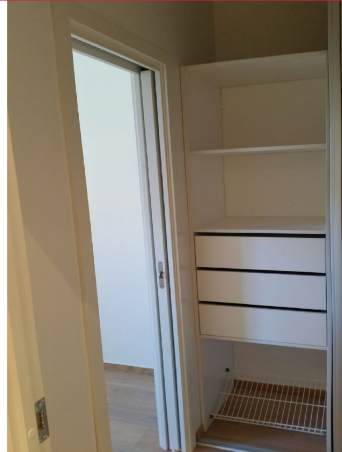
Gang med garderobeskap