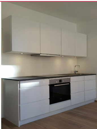
Velkommen til Odins gate 19B - En praktisk og arealeffektiv 1-roms med god beliggenhet!