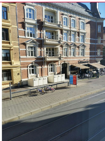
Fra leiligheten er det trivelig utsikt mot Elisenberg