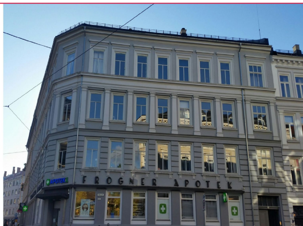
Leiligheten ligger rett ved Elisenberg på Frogner - kort vei til off. komm, dagligvare, apotek mm.