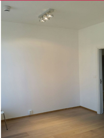
Leiligheten er holdt i lyse, moderne farger og gir et godt førsteinntrykk