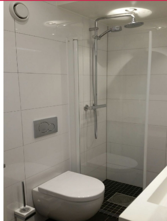
Helfliset baderom med vegghengt toalett, heldekkende servant og regnfallsdusj