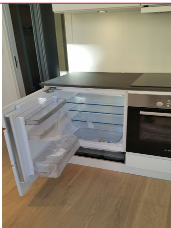
Kjøkkenen med integrerte hvitevarer