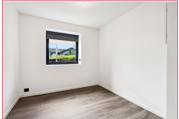
Soverom 1 og 2 har begge plass til dobbeltseng i tillegg til garderoben og kanskje en arb.plass