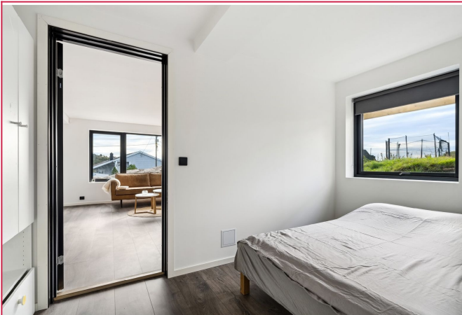
Praktisk soverom med helt ny seng. Garderobeskap følger også med.