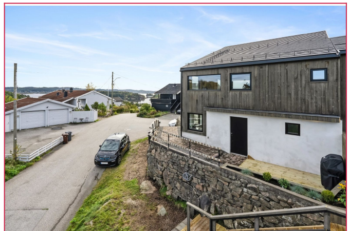
Fra eiendommen er det utsikt mot sjøen. Parkering blir etablert mellom Utleiemeglerbil og muren.