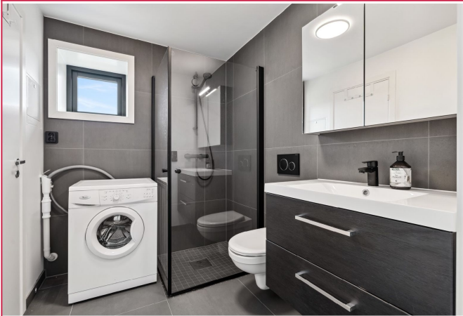
Lekker bad med mørke grå fliser, mosaikk i dusjsone. Medfølgende vaskemaskin. Pen innredning skap.