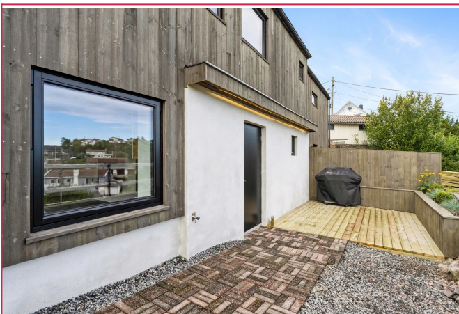
Flott uteplass og egen adkomst tilhørende utleieboligen