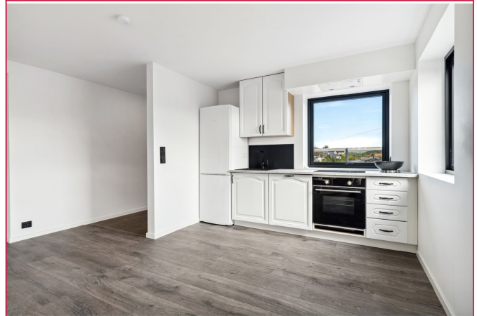
Pent og klassisk kjøkkeninnredning med integrert komfyr, platetopp og oppvaskmaskin.