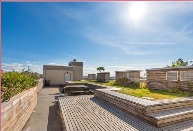
Sameiet har en flott felles takterrasse