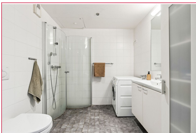
Pent flislagt bad med varme i gulv og vaskemaskin