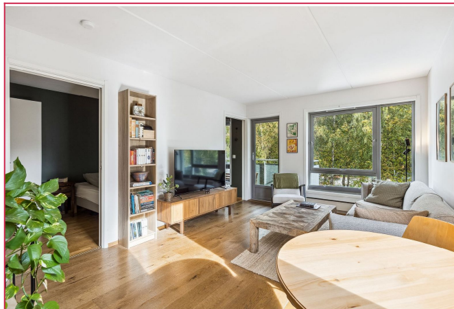
Lys stue med utgang til balkong