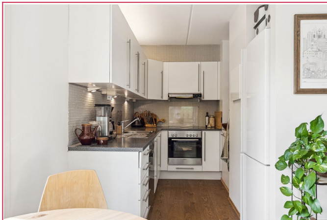
Delvis åpen kjøkkenløsning mot stuen, hvitevarer medfølger