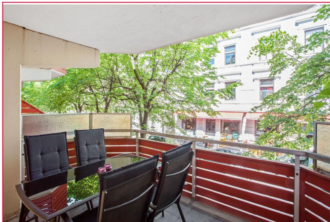
Terrasse ut mot rolige Kongsberggata.

SAKSNUMMER 12924 - BERGENSGATA 8 C, 0468 OSLO