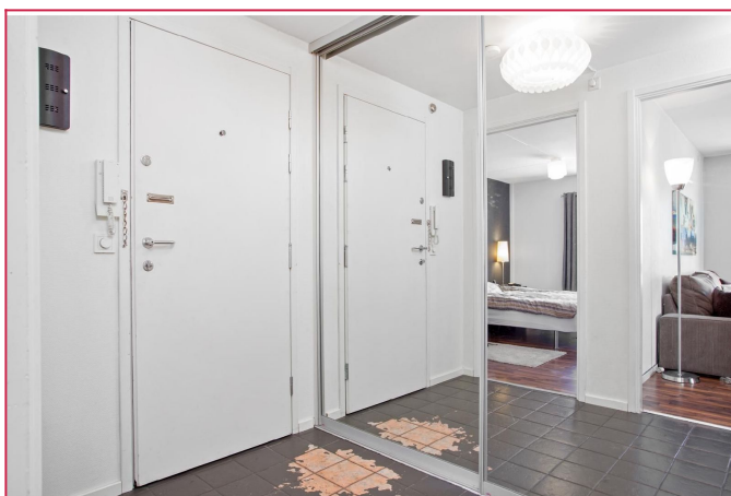
Entré med skyvedørgarderobe.