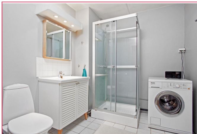
Pent flislagt bad. Vaskemaskin følger ikke med.