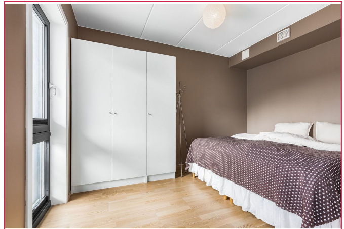
Boligens største soverom med god plass til dobbeltseng og garderobeskap.