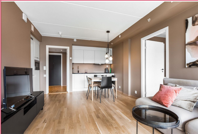
Boligen har en åpen stue-/ kjøkkenløsning med plass til både sofa og spisegruppe.