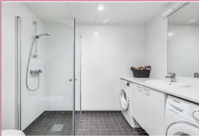
Flott flislagt bad med gulvvarme. Vaskemaskin medfølger.