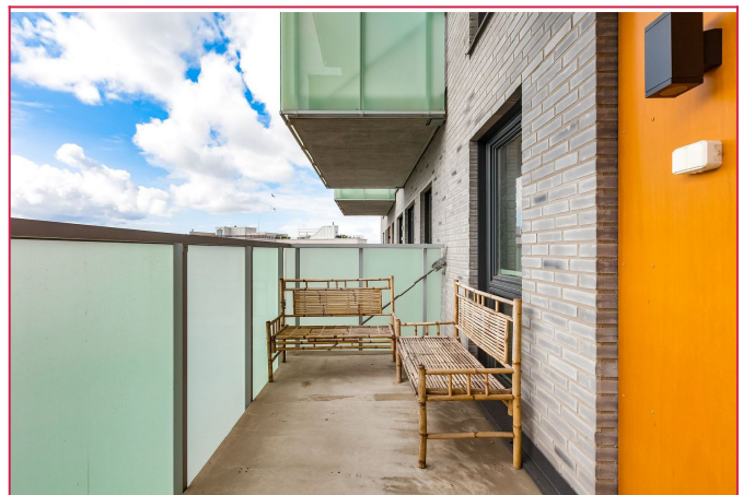
Stor og flott balkong med god plass til utemøbler.