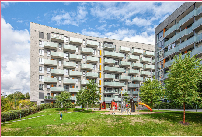
Fasade. Boligen ligger i byggets 6. etasje med stor balkong.