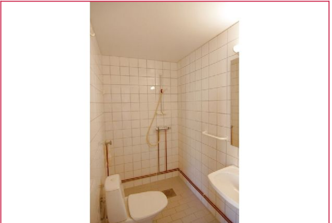
Badet har opplegg til vaskemaskin.