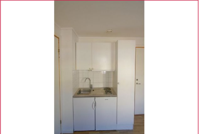
Hybelkjøkken inneholder steketopp og kjøleskap med en liten fryseboks.