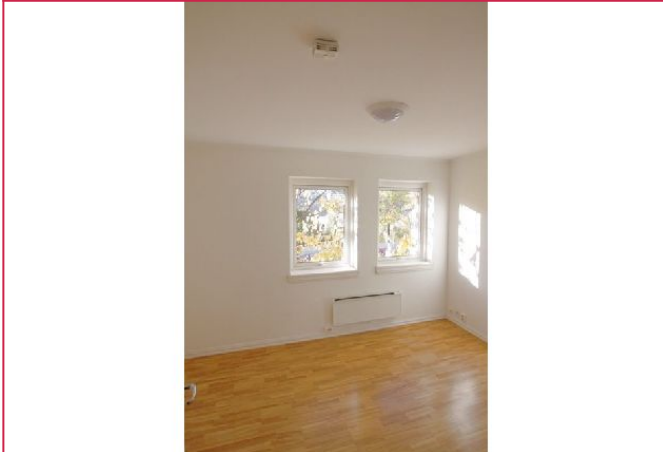
To vinduer i rommet, som gir gode lysforhold