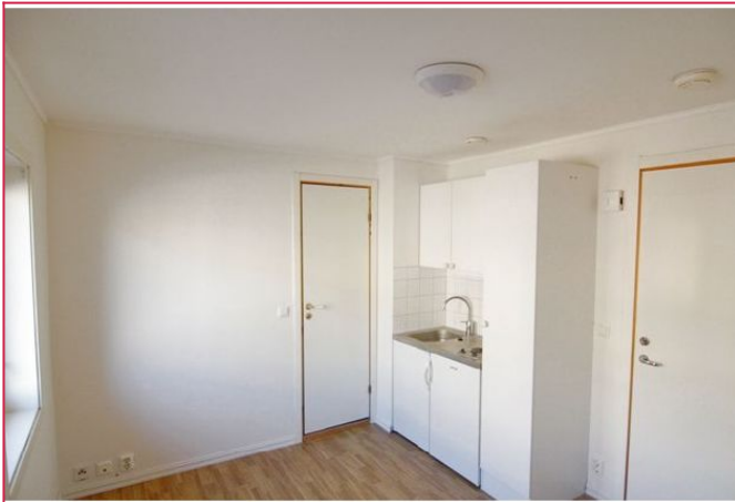
Leiligheten har strøm, oppvarming og varmt vann inkludert.