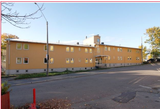
Velkommen til visning på Enebakkeveien 47!