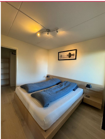
Soverom med walk-in-closet