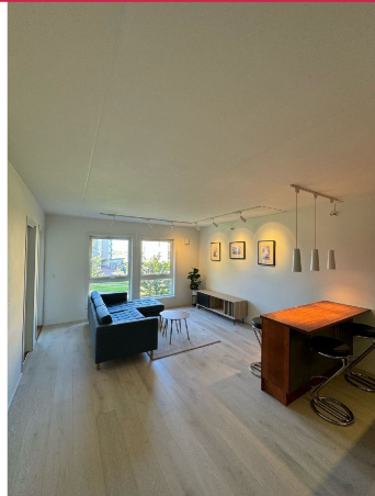
Stue og kjøkken i åpen løsning