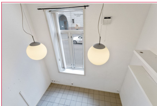
Praktisk leilighet med god takhøyde. 2 store taklamper og stort vindu skaper fint lys.