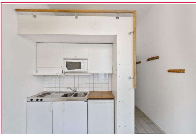
Kjøkkenet er av enkel løsning - skapplass, kombiskap, komfyr, mikrobølgeovn mm.