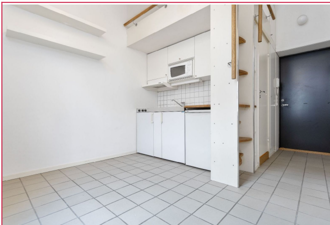
Trapp fra entre til hems, eget bad og kjøkken - effektiv planløsning.