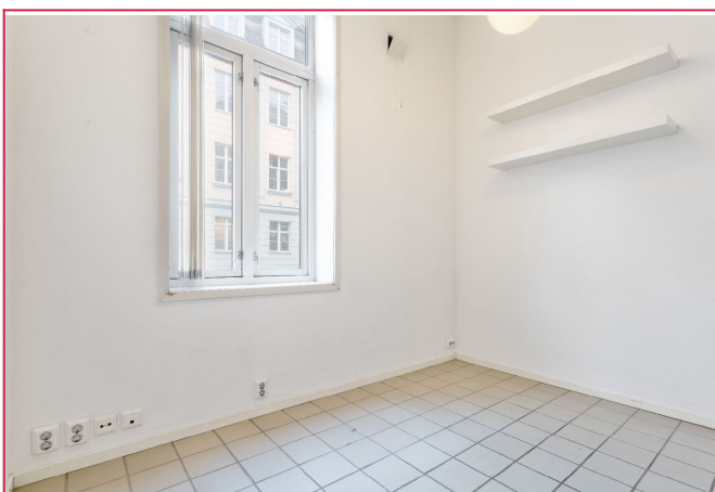
Stort vindu i stue. Plass til sofa, skap, TV og hyller.