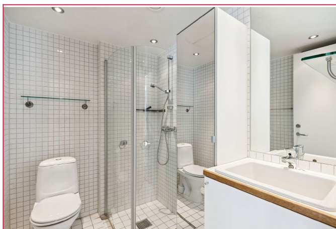
Bad innredet med vaskemaskin.