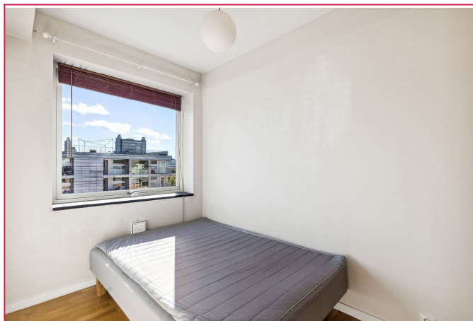
Varmtvann og internett inkl. i leien.