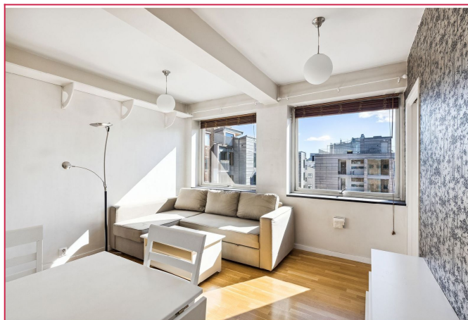
Det er felles takterrasse i bygget.