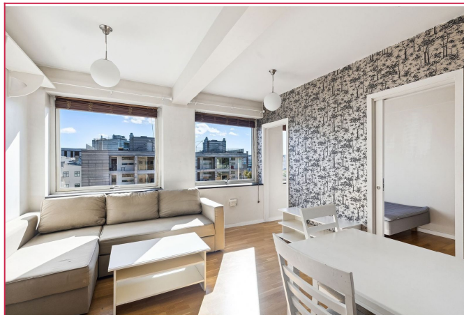
Leies ut møblert.