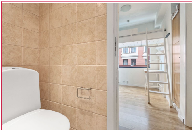
Bilde fra badrom ut mot kjøkken/stue.