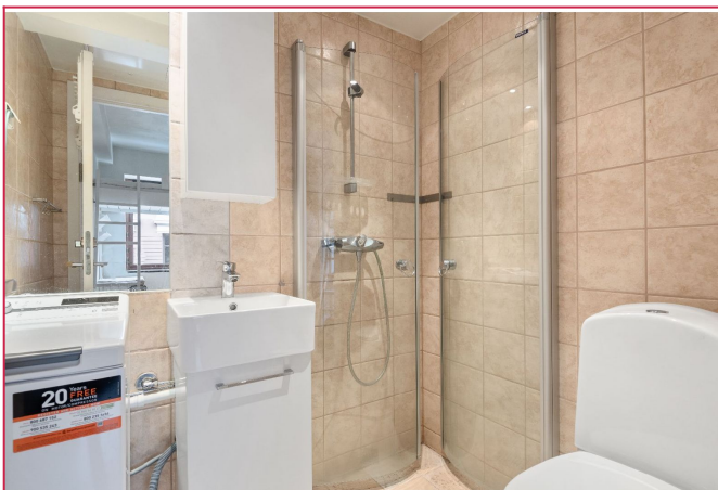
Nyere flislagt bad med varmekabler. Toppmatet vaskemaskin medfølger leieforholdet.