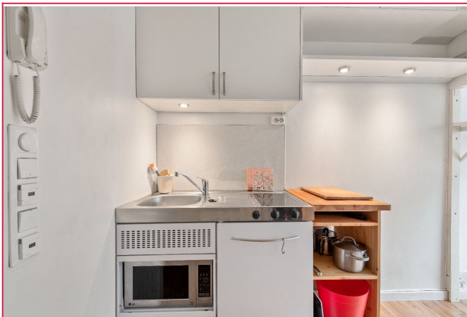
Praktisk hybelkjøkken med induksjonstopp, mikrobølgeovn og kjøleskap.