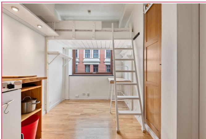
Praktisk hems med seng og god mulighet for innredning under hemsen.