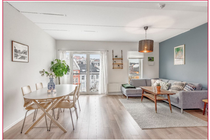
Fransk balkong fra stua