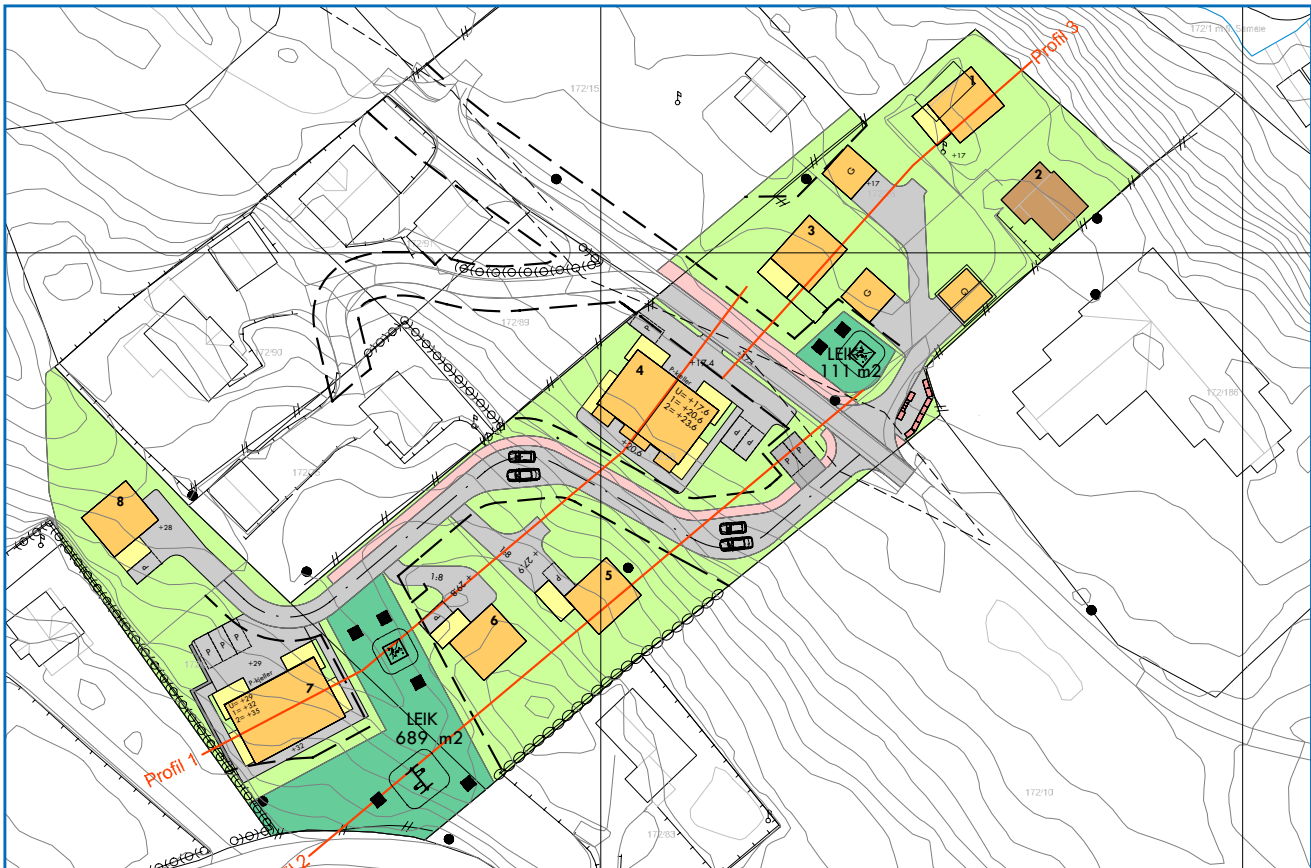
Reguleringskart - Sjøvold