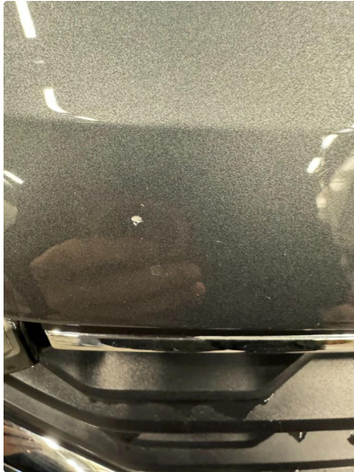
1.1 Mye steinsprut