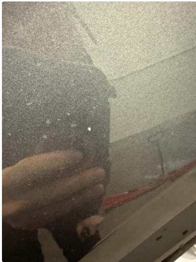
1.3 Noe steinsprut