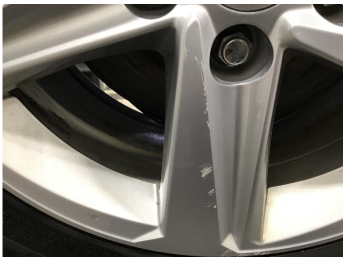
1.1 Ripe (r) gjennom lakk