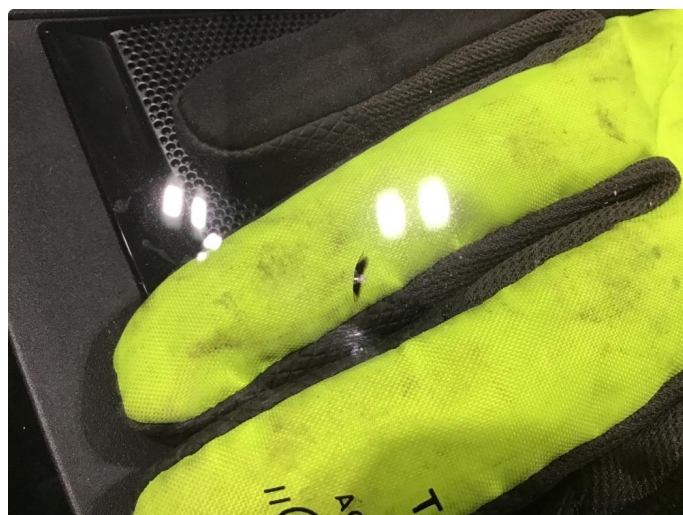
1.3 Reparert steinsprang på frontrute