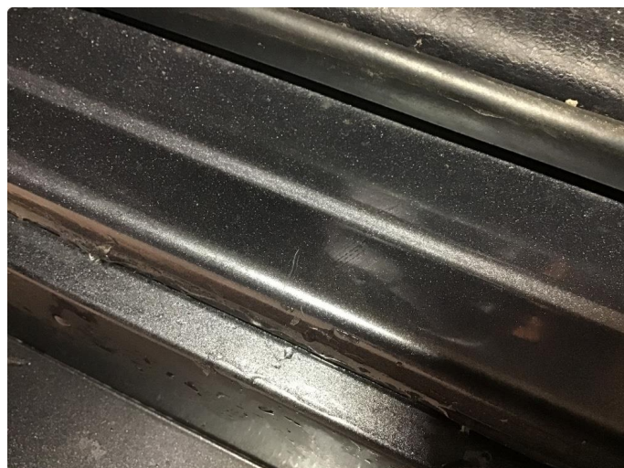
1.2 Noen riper i innsteg