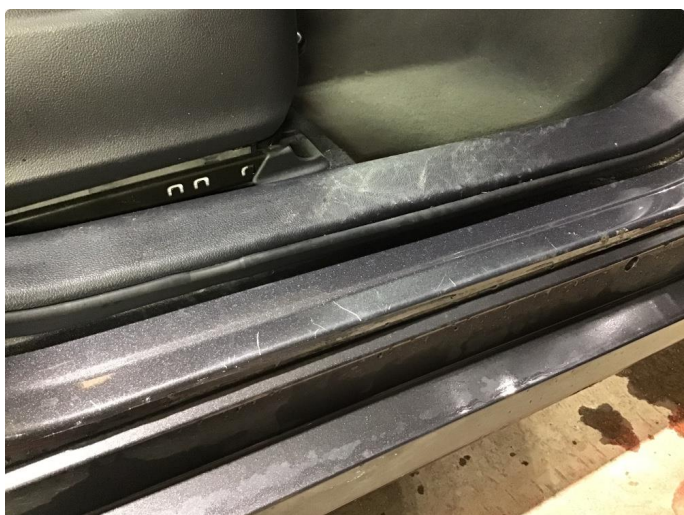
1.2 Noen riper i innsteg