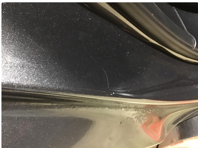
1.2 Noen riper i innsteg