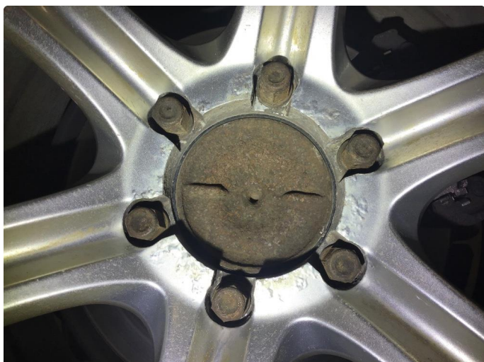
1.3 Navkopp mangler