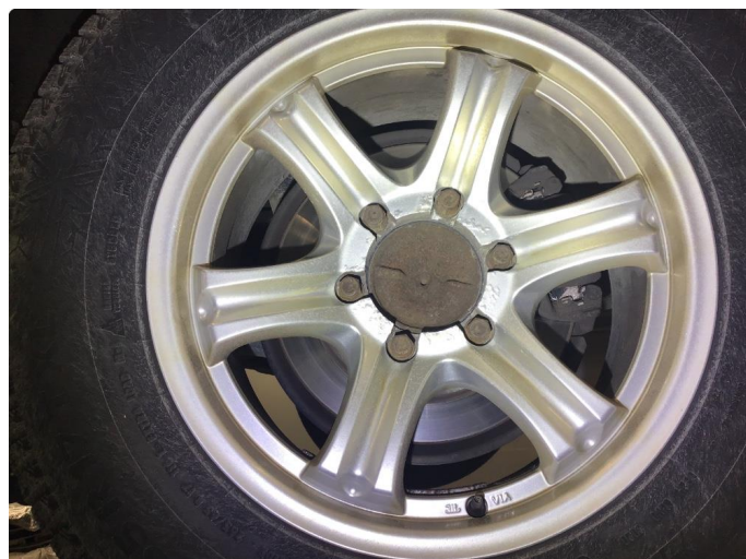
1.3 Navkopp mangler