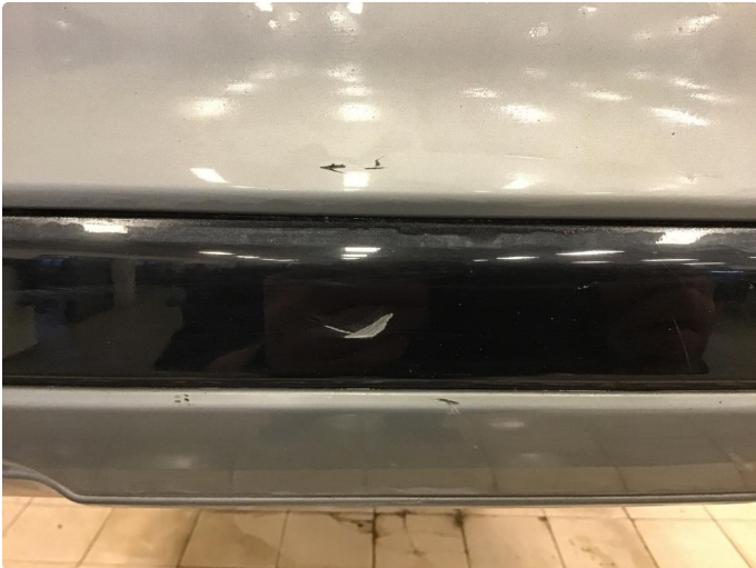
1.1 Ripe(r) ned til grunning