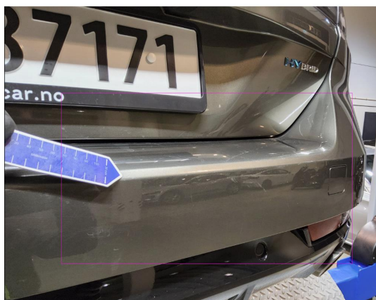
1.5 Diverse riper på bakfanger