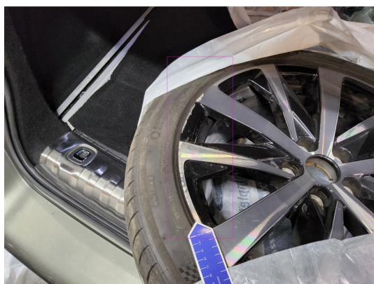
1.3 Kantkjørt felg sommer alu