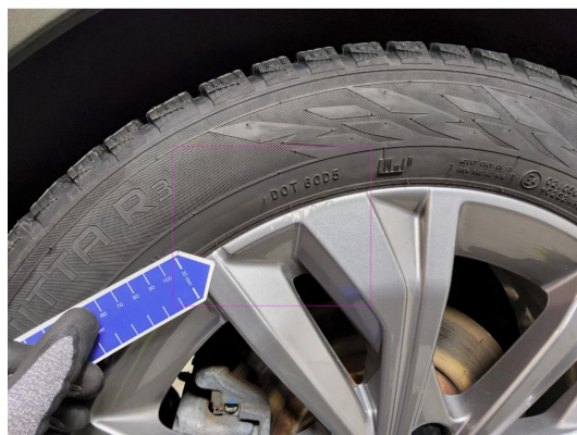
1.2 Kantkjørt alu felg vinter