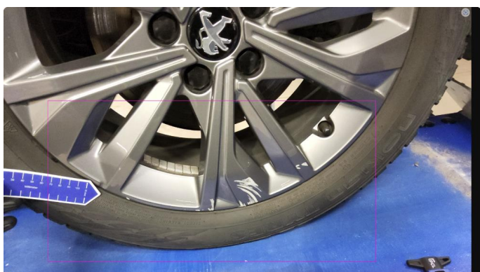
1.1 Kantkjørt alu felg vinter