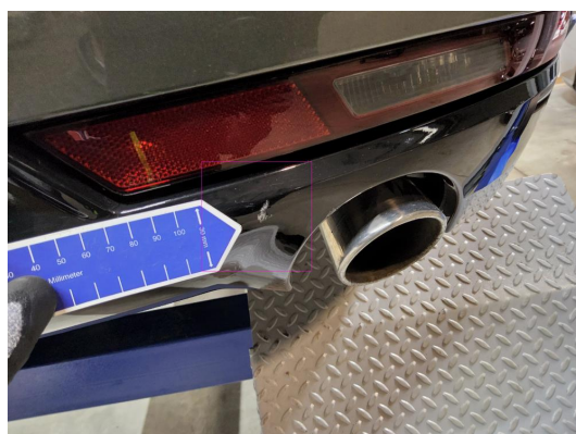
1.5 Diverse riper på bakfanger